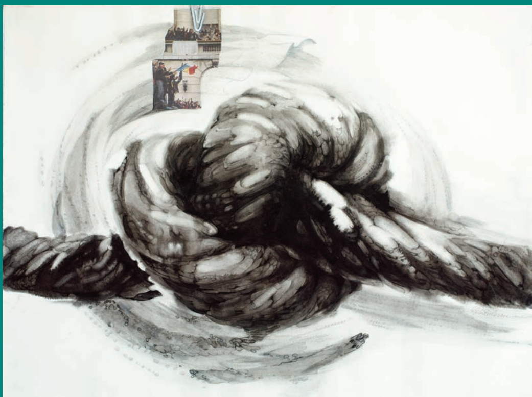
Semne pentru neuitare I