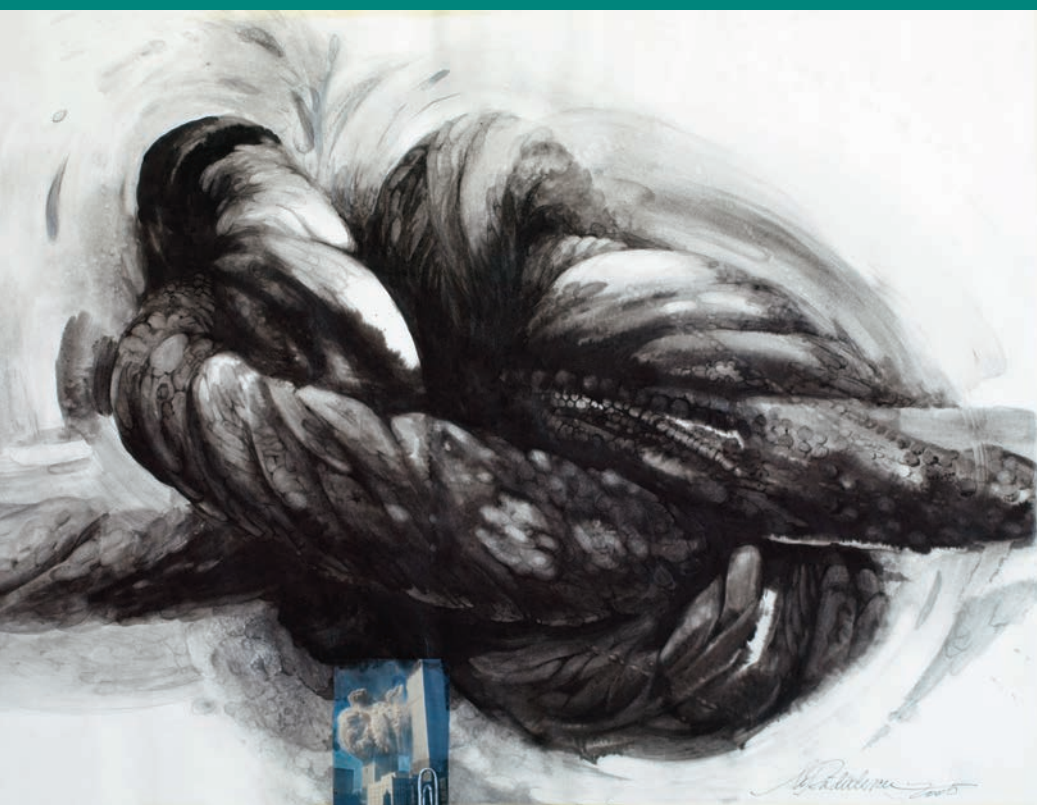
Semne pentru neuitare II

L.I.S.: Tristă întrebare, sunt atâtea lucruri ascunse... România continuă să construiască o democrație originală. Până și economia de piață de la noi (care ține statul pe picioare) se bazează pe... consum. România de azi îmi amintește de Iugoslavia comunistă, în care un sfert din populație mergea la noroc la muncă în Occident să câștige un ban adevărat, cu care se construia o vilă în țară și se cumpăra o mașină la mâna a doua în familie. La noi s-a perpetuat „sistemul” (nu ocupi o