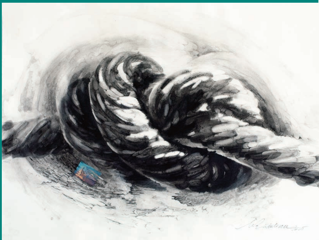
Semne pentru neuitare III