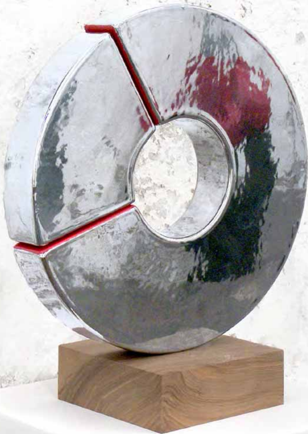
Pietà. Ceramică, platină, lemn